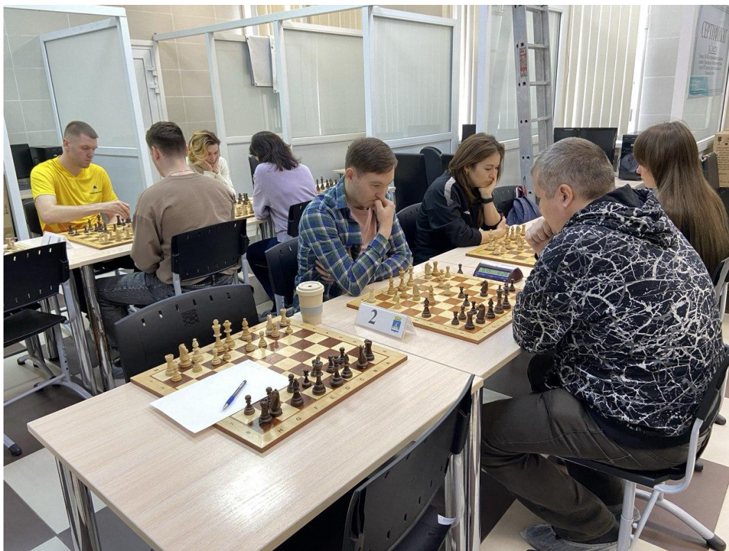
На фото: участники соревнований

Продолжение Спартакиады обещает быть не менее захватывающим, ведь впереди соревнования по настольному теннису. Это отличный шанс для всех участников проявить себя в новом виде спорта и внести свой вклад в общую копилку достижений коллектива. Желаем всем участникам удачи и успехов в предстоящих соревнованиях!