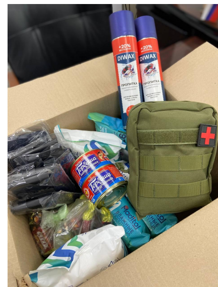
На фото: подарки на 23 февраля для мобилизованных коллег

В этот праздник мужества, доблести и отваги мы поздравляем наших героев, сражающихся на СВО, и благодарим их за то, что они делают для России и нашего будущего. Кроме необходимых вещей в каждый подарок была вложена открытка с Днем защитника Отечества с самыми добрыми пожеланиями и словами благодарности от генерального директора и председателя Профсоюзной организации.