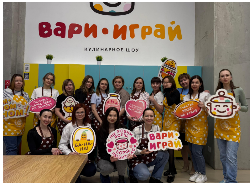
На фото: члены профсоюза Аппарата управления

Этот мастер-класс укрепил командный дух и подарил участникам массу положительных эмоций.