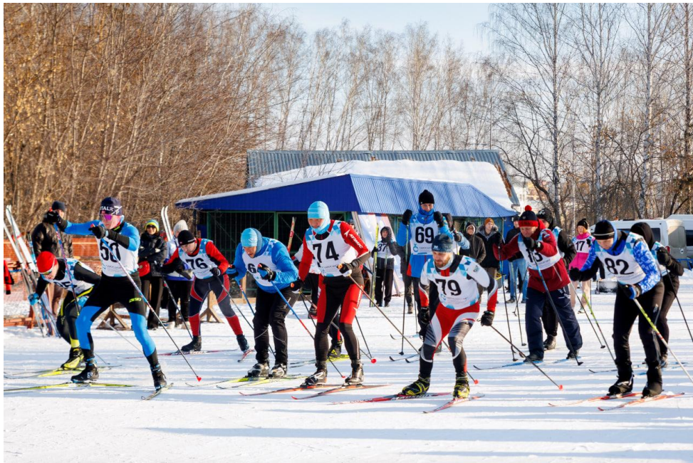
На фото: мужской забег на 5 км.

Личный зачет. Женщины. 3 километра: 1 место - Гилева Гульнара, главный специалист, отдел перспективного планирования (07:52)