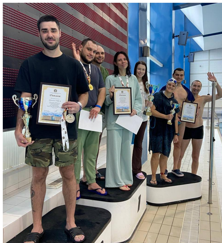
На фото: участники соревнований по плаванию

Третья позиция была завоевана командой УНП-3, которая добилась успеха благодаря целеустремленности и стойкости своих участников.